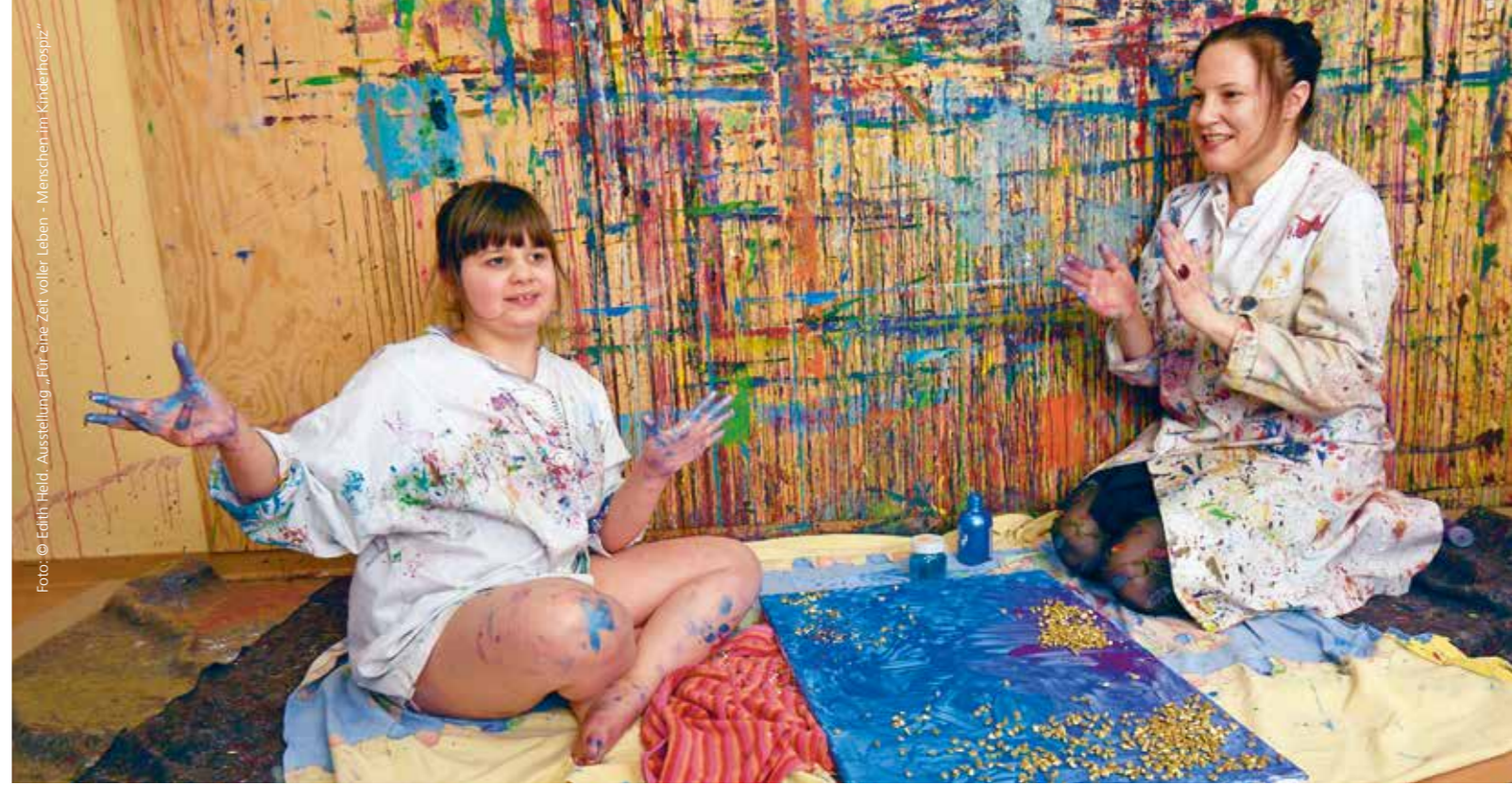
Ausstellung „Für eine Zeit voller Leben - Menschen im Kinderhospiz“